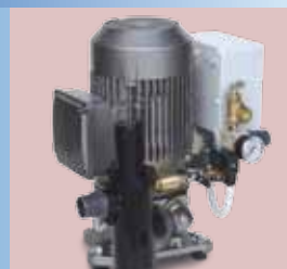
P002 - P002/S