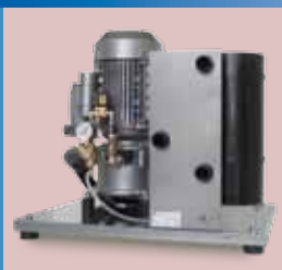
P001/SB - P001/PB - P001/TP