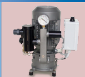
P001 - P001/S - P001/P - P001/T